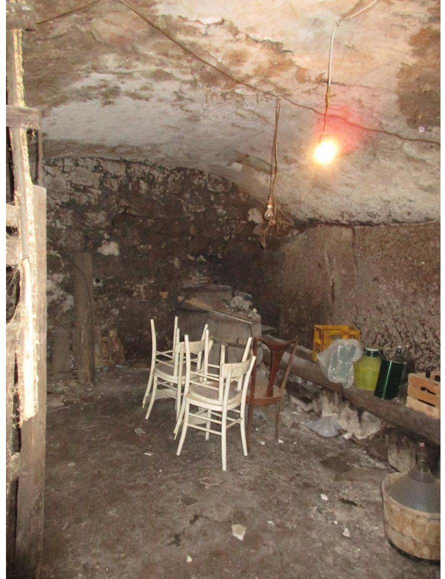
Cantina – Foto 43